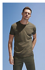
SOL'S REGENT 11380