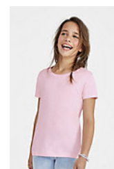
SOL'S CHERRY 11981