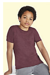
SOL'S REGENT FIT KIDS 01183