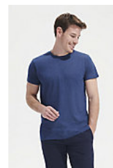
SOL'S REGENT FIT 00553