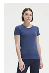
REGENT FIT WOMEN 02758