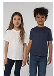
SOL'S REGENT KIDS 11970