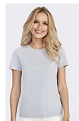
SOL'S REGENT WOMEN 01825