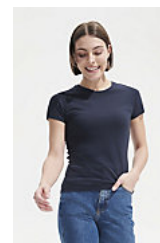
SOL'S MISS 11386